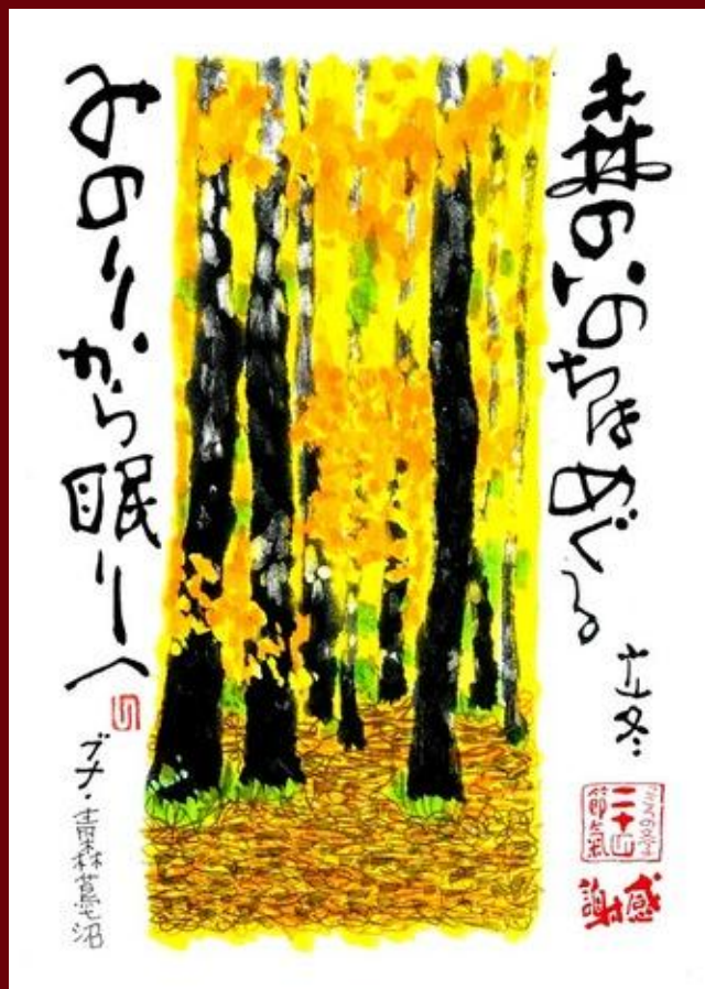
落合勲先生の「こころの文字 二十四節氣」より