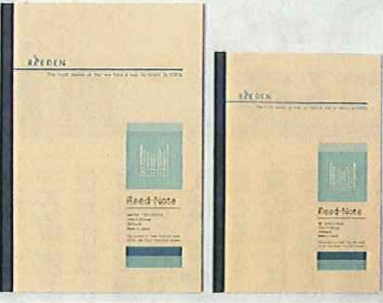
写真:ReEDENシリーズの「ヨシノート」(左)と「ヨシメモ」(右)の製品写真

コクヨグループの株式会社コクヨ工業滋賀(本社:滋賀県愛知郡愛荘町/社長:山内健)は、琵琶湖・淀川水系のヨシを使用し、環境に配慮した紙製品「ReEDEN」シリーズを開発し、十一月一日から京都府・滋賀県内の文具店等を通じて発売しました。