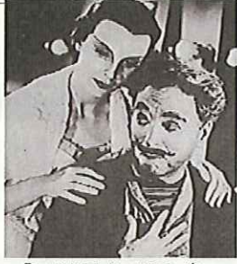
「ライムライト」1952・米チャップリン晩年の傑作

「勇気(プレーバリー)と想像力(イマジネーション)と、わずかなお金(ア・リトル・マネー)さえあれば、人は生きていける」